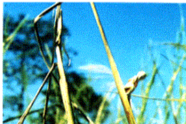
علائم خسارت بیماری یو فرا در مراحل مختلف رشدی برنج