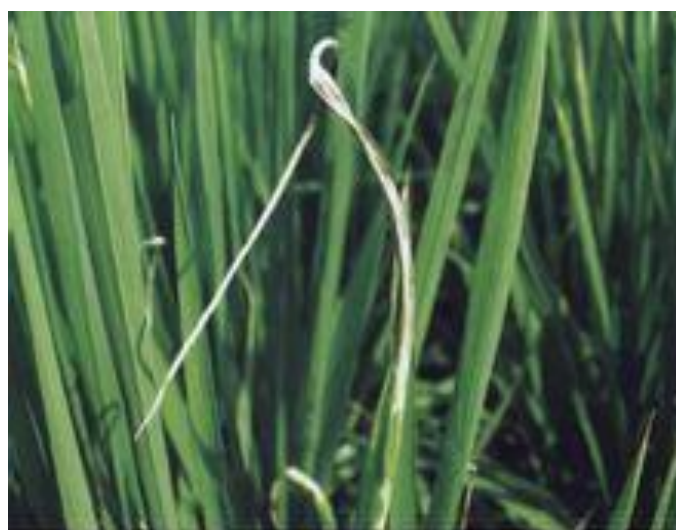
图 5-82 水稻干尖线虫为病叶片症状

گل آذین: شکل و رنگ غیر عادی، برگ‌ها: ایجاد زخم، زردی، شکل و رنگ غیر عادی دانه‌ها: دانه‌های پوک، رنگ غیر عادی، ساقه‌ها: رشد غیر عادی، کل گیاه: مرگ گیاه، کوتولگی و پیری زودرس